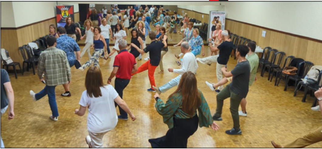
· Aulas da Academia Danças do Mundo

Encontraram uma recomendação no site internacional “Kizdroid” sobre alguns dos melhores professores e locais para aprender Kizomba, por vários cantos do planeta e descobriram a Casa do Concelho de Tomar!