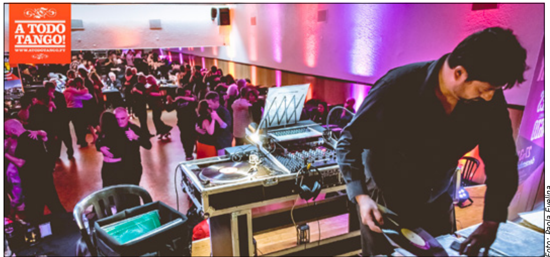
· Milonga "A Todo Tango"

Em complemento, realiza-se mais 2 actividades: