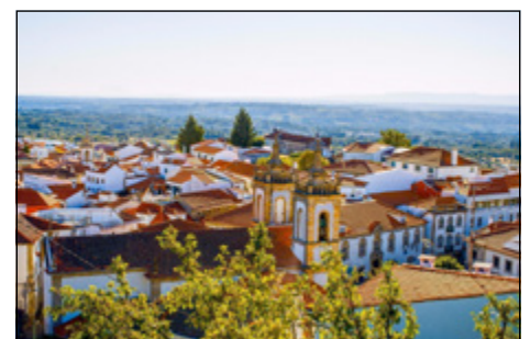
• Gouveia – vista do centro