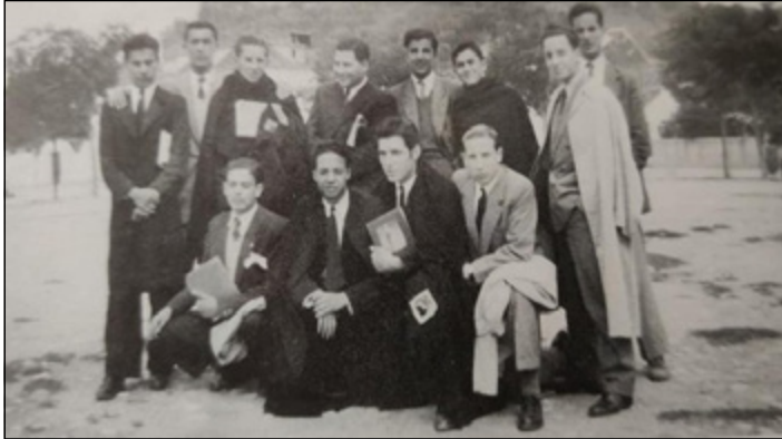
· Aluno do CNA –Tomar