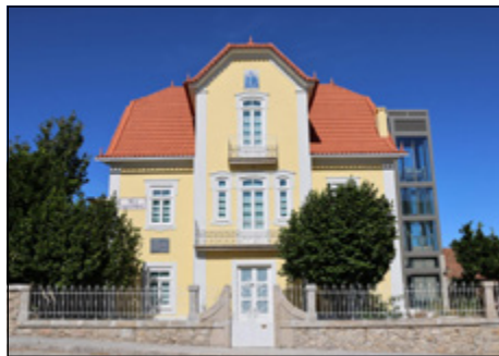
• Melo – Casa (para sempre)

Assim, e com partida pelas 10 horas da manhã, o passeio até Gouveia pretenderá dar um “cheirinho” de cada uma destas atrações, parando logo no sábado, dia 28, em Vila Nova de Tazem para um almoço no qual será servida pelo restaurante “Cunha” a Alambicada, prato tradicional desta vila que é confeccionado à base de borrego e vinho branco. É aqui, no baixo concelho, que se concentra a maioria dos vinhos Dão de altitude (sub-região da Serra da Estrela), pelo que o almoço será servido na adegada da