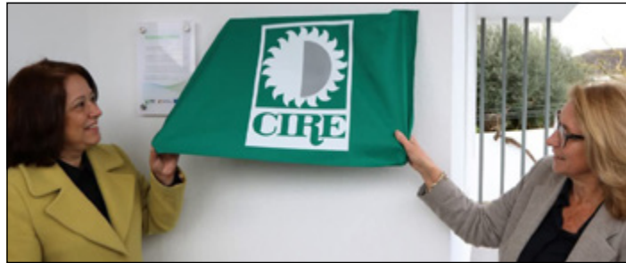
• Inauguração – Residência Autónoma nas Algarvias

Há 49 anos, nascia oficialmente o Centro Infantil de Recuperação de Tomar, como era denominado na altura. Fruto do empenho de um grupo de pais de crianças com deficiência, que com uma enorme ousadia, conseguiu reunir fundos e envolver a comunidade Toma-