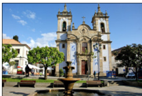
• Gouveia – Praça S. Pedro