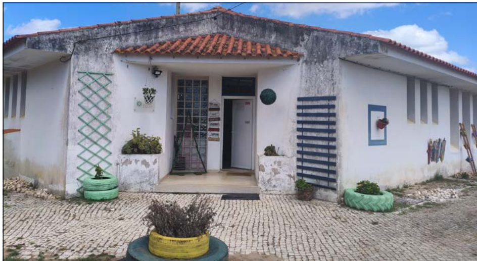
Sede da ASMMT

Podem acompanhar a nossa atividade no site www.asmmt.org ou nas redes sociais Instagram e Facebook