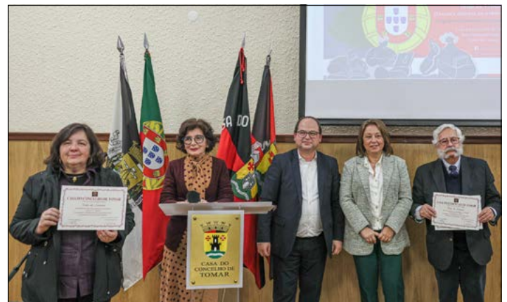
Voto de Louvor da CCT à comunicação social de Tomar