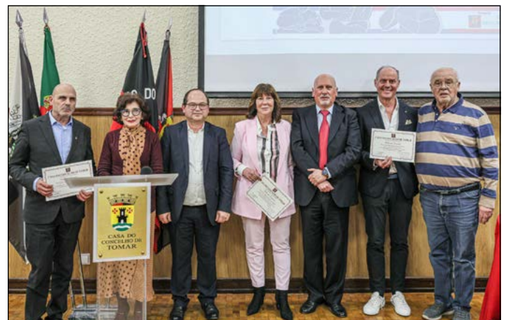
Votos de Louvor da CCT a associados