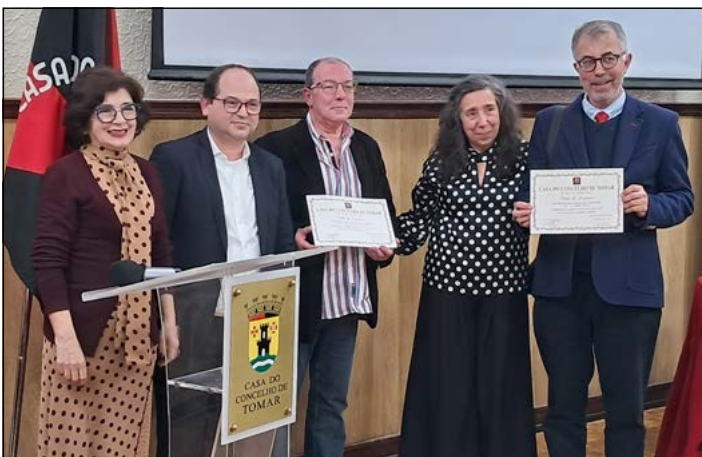
Voto de Louvor da CCT à comunicação social internacional