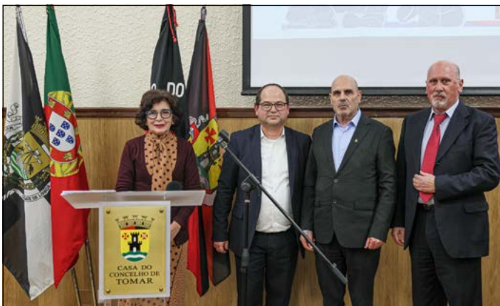
"Alfinete de Prata" de 25 anos de associado da Casa do Concelho de Tomar

Texto: Ernesto Jana