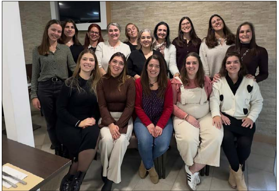
Equipa multidisciplinar ASMMT

munidade pelo máximo de tempo possível e com a intervenção de uma Equipa Multidisciplinar (psicóloga, assistente social, Enfermeira Especialista em Saúde Mental e Terapeuta Ocupacional);