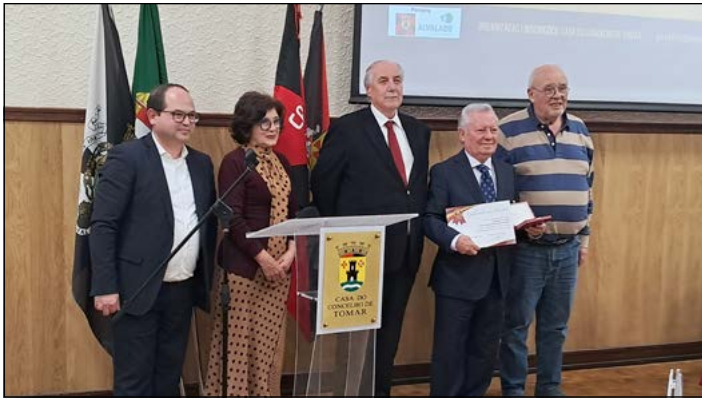
Galardão de Mérito da Casa do Concelho de Tomar